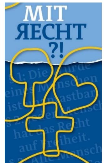
Bild: Plakat Jugendsonntag 2022_bja Wernau

Ökumenisches Hausgebet im Advent am 5. Dezember Die Texthefte dazu werden mit der Spirale verteilt.